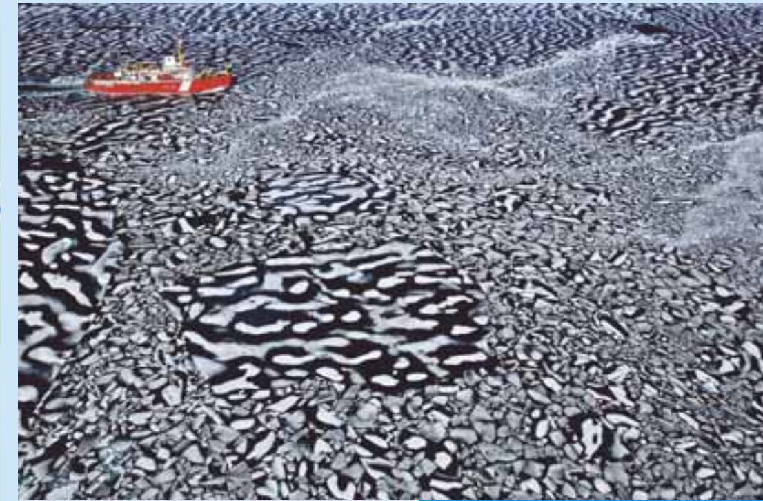
Yann Arthus Bertrand, « Arctique ». Collection particulière

du vendredi 10 février au lundi 9 avril 2012