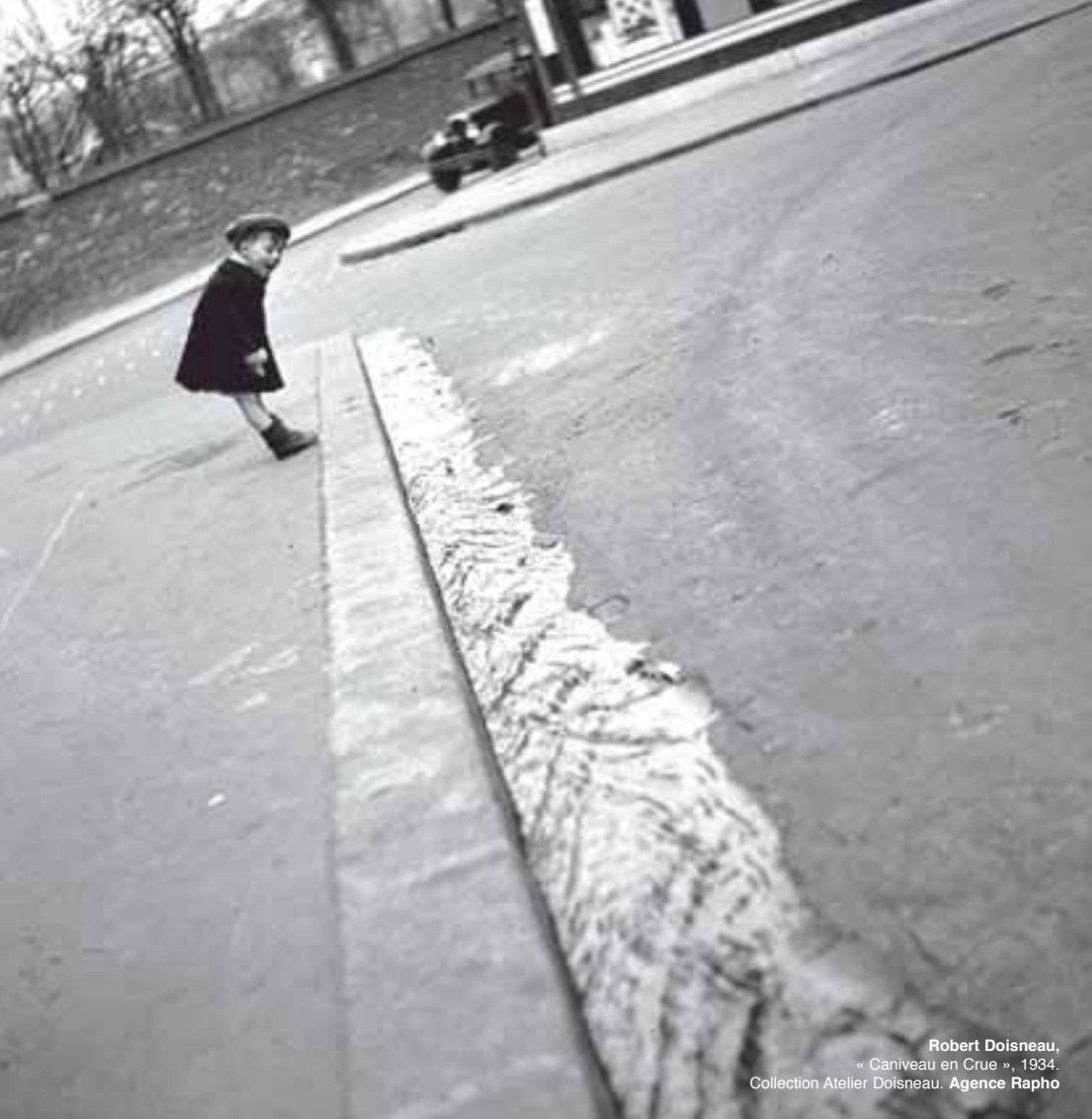
Robert Doisneau, « Caniveau en Crue », 1934. Collection Atelier Doisneau. Agence Rapho